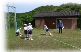
【体力テストの様子】

3日間にわたって体力テストを実施しました。去年より体が大きくなったことと毎朝の体力作りの成果もあり、投げ方や跳び方、走り方に迫力が出てきました。今回の結果を基にして、体育の学習や遊びを通して更に体力を伸ばします。